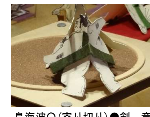
鳥海波○(寄り切り)●剣 竜