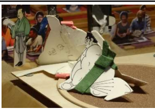
虎ノ國●(押し倒し)○生駒山

「よし！今場所はいいぞ！優勝だ！」と十九親方が関西で朗報を耳にして「ニヤッ！」と微笑んでいるに違いない。