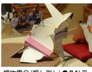
櫻吹雪○(押し倒し)●冬牡丹