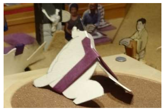
醍醐●(寄り切り)○若 巨

初土俵以来、18勝2 敗、勝率9割と華々し い戦績で、新生霧ヶ浜 部屋2人目の関取とな った。霧ヶ浜親方の期 待も、改名ならぬもの が、改名した四股名 からもその期待のほど が伺える。