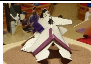
寶 蔵○(引き落し)●若 巨