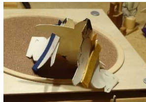
大 樽○(寄り切り)●照の王

江戸川部屋期待の剛勇山は初日から見せ場 を作る事無く3連敗で 苦しいスタートとなっ た。今場所新入幕の2 力士の結果は、朱雀湖 が初日の磯光に続き二 日にも曲者琴乃王を 連日寄り切りで降し、