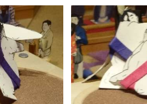
綱 嵐●(寄り切り)○葵 盛