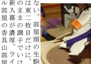
磯日丸●(寄り切り)○寶 蔵