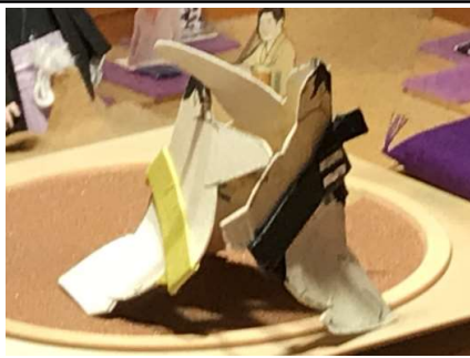
四季嶋○(寄り切り)●美空

退け9連勝としたが、九日目その春ノ翔に敗れた千代鈴は1敗の後退し、ここで春ノ翔と美空富士が四季嶋、佐賀ノ海にまさかの連敗を喫し後半戦に入ってから波乱が巻き起こった。また、2敗で追う7力士のうち、佐賀ノ海、四季嶋、綱嵐が2敗を守り優勝戦線に残った。