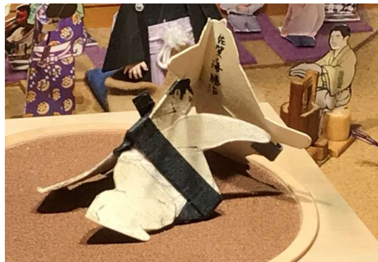
佐賀海は今場所最大の難関の横綱戦を制して7勝目を上げた。大関当確の8勝まであと白星一つだ。