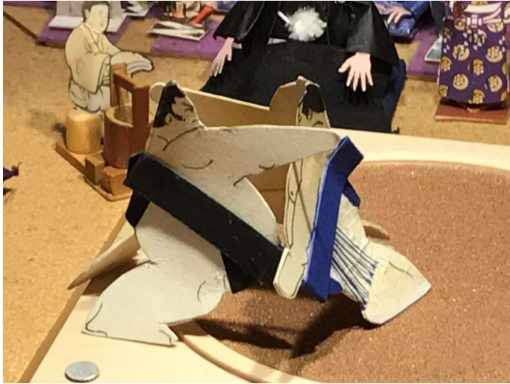
↑七日目、新たな後援会も発足し、実力人気とも急回復した大神楽だが、絶対調の横綱若ノ嶋の前に土俵際の粘りも許されず、押し切られた。

第153回本場所は4月11日に三日目と四日目、4月17日に中日と七日目が行なわれたところだが、開催間隔が中5日と短かったことから新聞は2開催まとめての発行となった。七日目を終えて、7戦全勝は横綱若ノ嶋と平幕の鬼ヶ嶽の2力士となった。これを大関佐賀ノ海、平幕の白閃光、鹿富士の3力士が1敗で追う展開。