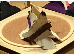
鬼ヶ嶽○(寄り切り)●玄武岩

初日から前へ出た。相撲で「かつての強かった鬼を彷彿とさせる相撲。今場所の鬼は違ふ」と錦風親方がその好調さを力説する。