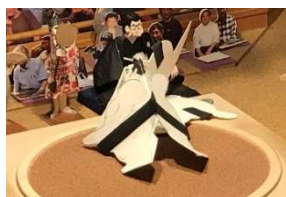
熊 鷹●(押し倒し)○天 真

他には鎧鳥とともに優勝候補の勝間田部屋、唐紅、進境著しい秋田部屋の出で初土俵を踏んだ加古川部屋一三山、大松戸、荒笠親子の戸締、城らが初日を白星で飾った。