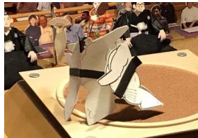
稲瀬川●(寄り切り)○一三