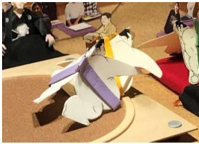
千丈岳○(下手投げ)●虹ヶ谷

他には磯蛸と千丈岳の磯ノ海勢、そしていきなり優勝に絡んできた玉乱が恐い存在になってきそう。