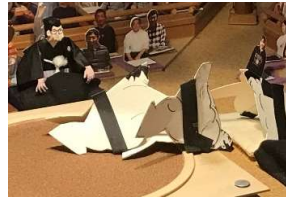
筑波海○(押し倒し)●笹 熊