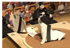
熊 王●(押し倒し)○唐 紅

三段目の優勝候補の栢尾山といい、最近日根勢の若手に勝るとも劣らない有望力士揃いだ。