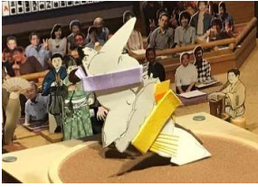
千丈岳●(押し倒し)○玉 乱