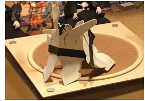
桃花田●(寄り切り)○鎧 鳥

強い力士を輩出し続ける春日根部屋。今場所の優勝候補一番手。真も優勝候、磯ノ海、実力部屋の末、押し倒