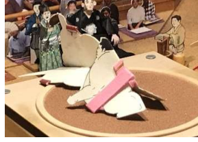
真田丸●(押し倒し)○櫻吹雪